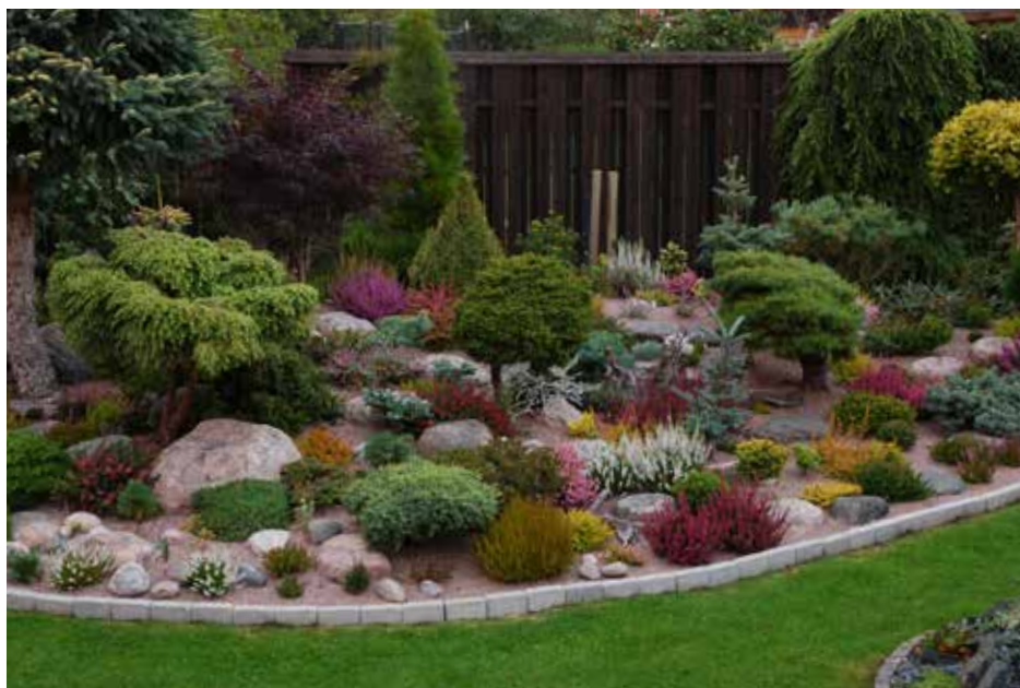
En rabatt med barrväxter och ljung hos Sonny Magnusson – se under "Ring så visar vi" på sidorna 20–21.